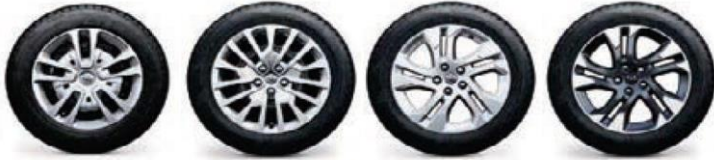
16" Black steel wheels with full wheel 17" Black steel wheels with full wheel 17" Silver alloy wheels with chrome 17" Bi-colour diamond cut alloy